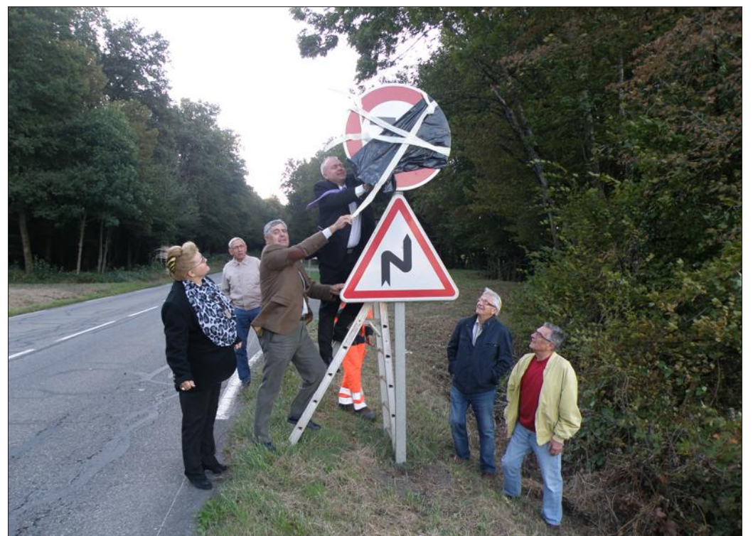
■ La vitesse est désormais limitée à 70 km/h sur le tronçon de la RD419 englobant les deux virages entre Bessoncourt et Frais.

De surcroît, toujours dans le même secteur, les 11 et